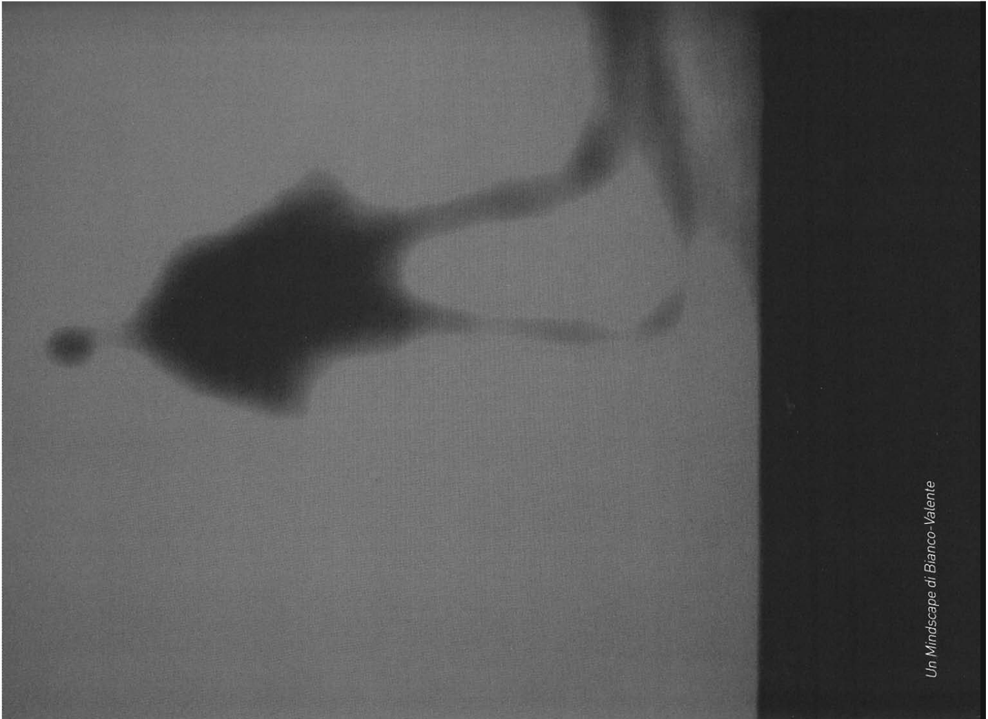
Un Mindscape di Bianco-Valente