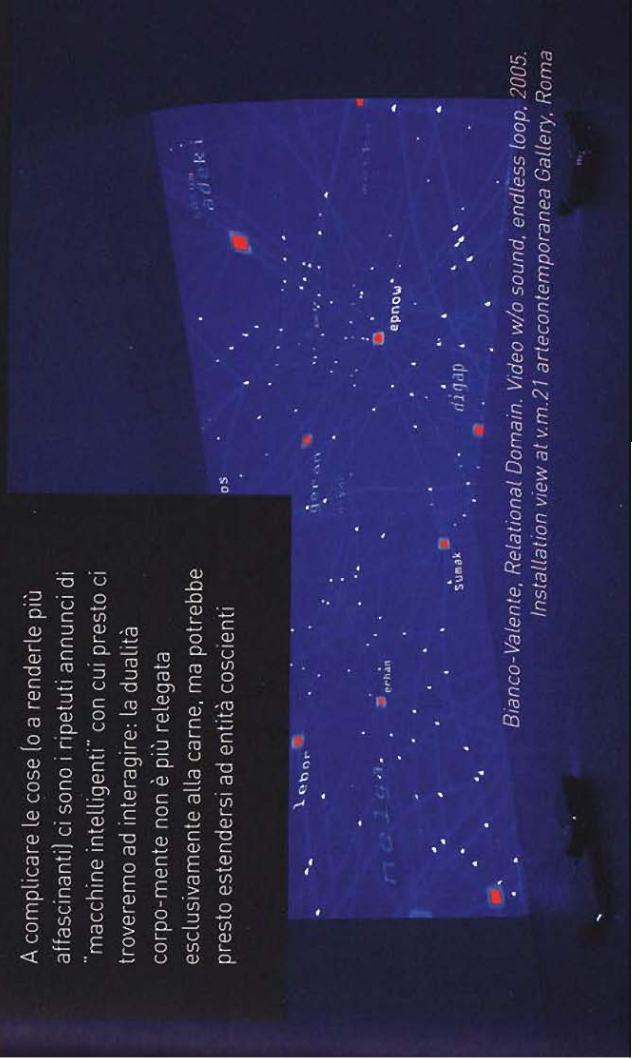
Bianco-Valente, Relational Domain. Video w/o sound, endless loop , 2005. Installation view at vm.21 artecontemporanea Gallery, Roma