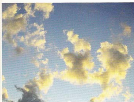
Bianco-Valente/Mass When the Sun Touches You , 2006 video still

In their videos, installations and in the plotter prints on canvas, deriving from frames of video camera films, they explore the point at which organic and inorganic, real and immaterial and the recording of life and its translation into viewing become confused. Populated by dematerialised human figures, reduced to fading shadows and mental traces evoked by voices and sounds generated using information technology means, the starting reality is destructured and distorted through the use of filters or coloured lenses in acid and fluorescent colour ranges, in a constant contamination of natural and artificial which gives life to mindscapes in which images/recollections and cerebral mechanics are re-elaborated in a sort of flow of conscience. "We know and are able to define the world that surrounds us by constructing and destroying in the mind a vast puzzle of elementary cognitions, which, interlinked, can constitute the base of