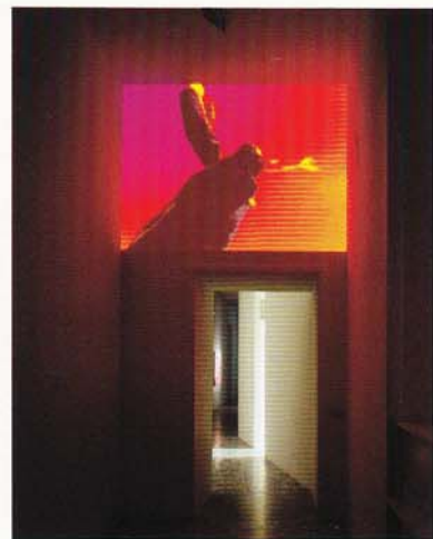
I Should Learn from You, Video, Sound Design by Mass, 2003. Installation view at Alfonso Artiaco Gallery, Napoli.