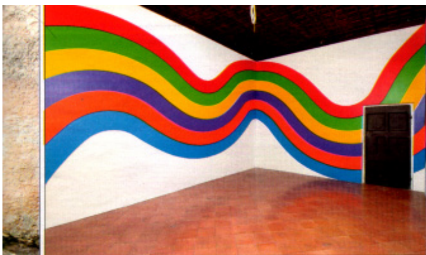
SOL LEWITT Wall drawing, 2004.