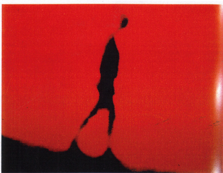
Bianco - Valente, 1998, stampa digitale a cera su tela + video installazione