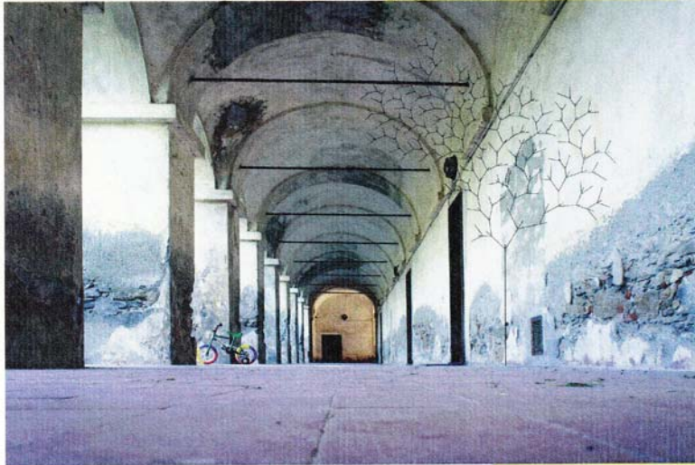
Dono di natura , 2011 installazione site specific, bozzetto preparatorio