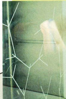
Convergenza evolutiva particolare, 2010, Pastello bianco a cera su vetro. Installazione site specific per la mostra Net in Space, Museo MAXXI, Roma